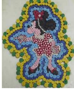
مشغولة رقم (٢ - ٤)