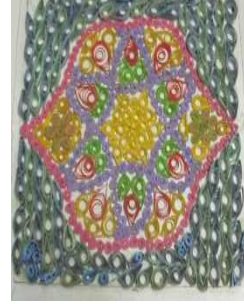
مشغولة رقم (١ - ٤)