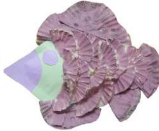
مشغولة رقم (٧- ٢)