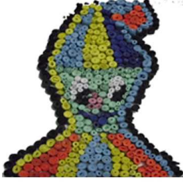
مشغولة رقم (٣ - ٤)

رابعاً: أعمال النشاط الرابع المنفذة وعددها ٥ أعمال وهي موضحة كالتالي: