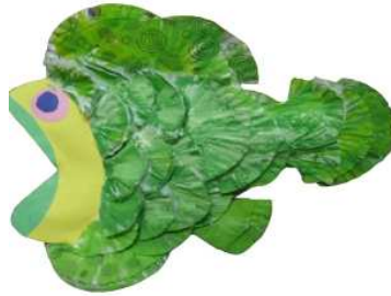
مشغولة رقم (٧- ٤)