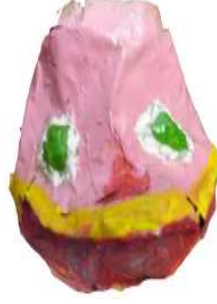
مشغولة رقم (٢ - ٤)