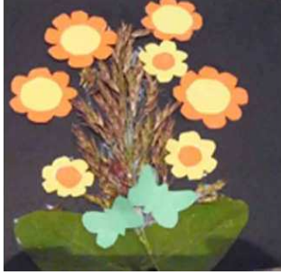
مشغولة رقم (١- ٣)

أولاً: أعمال النشاط الأول المنفذة وعددها خمسة أعمال وهي موضحة كالتالي