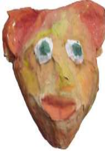
مشغولة رقم (٢ - ٣)

ثانيا: أعمال النشاط الثاني المنفذة وعددها ٥ أعمال وهي موضحة كالتالي: