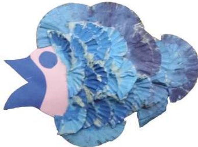
مشغولة رقم (٧- ٥)