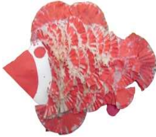
مشغولة رقم (٧- ٣)

سابعا: أعمال النشاط السابع المنفذة وعددها ٥ أعمال وهي موضحة كالتالي: