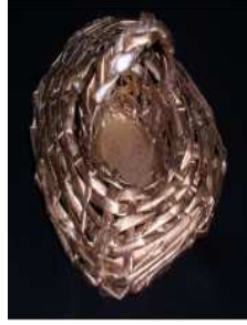
مشغولة رقم (٥- ٢)