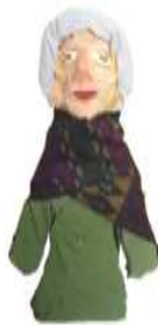
مشغولة رقم (٣- ٤)