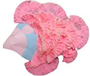
مشغولة رقم (٧- ١)