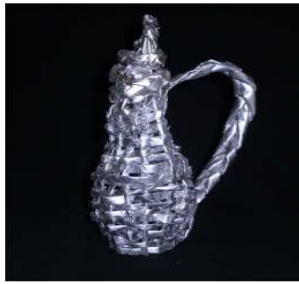
مشغولة رقم (٥- ٥)