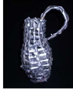
مشغولة رقم (٥- ١)