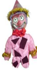
مشغولة رقم (٣- ٤)