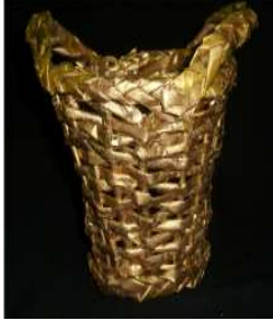
مشغولة رقم (٥- ٣)

خامسا: أعمال النشاط الخامس المنفذة وعددها ٥ أعمال وهي موضحة كالتالي: