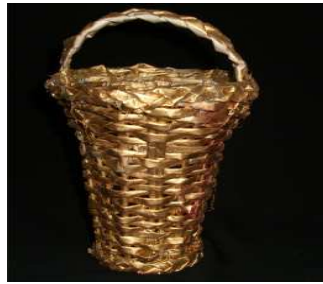
مشغولة رقم (٥- ٤)