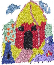
مشغولة رقم (٥ - ٤)